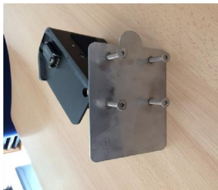
Dele der udleveres ved montering på hegn.