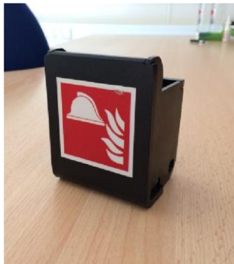
Den bevægelige del af nøgleboksen, skrues helt i bund. monteres af Brand & Redning