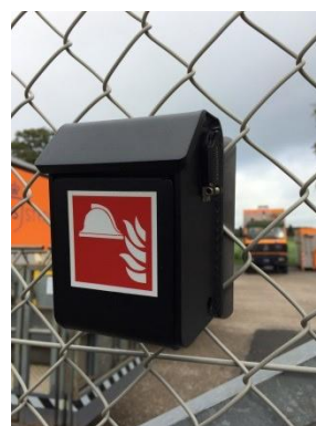
Nøgleboksen monteret skruendeer af!