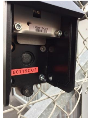
Undersænkede skruer skal

Her leveres der til montering af nøgleboksen en hegnsplade med 4 stk. skruer. Hegnspladen placeres på den indvendig side af hegnet og boksen på den anden side og monteres herefter med de 4 medfølgende undersænkede maskinskruer.